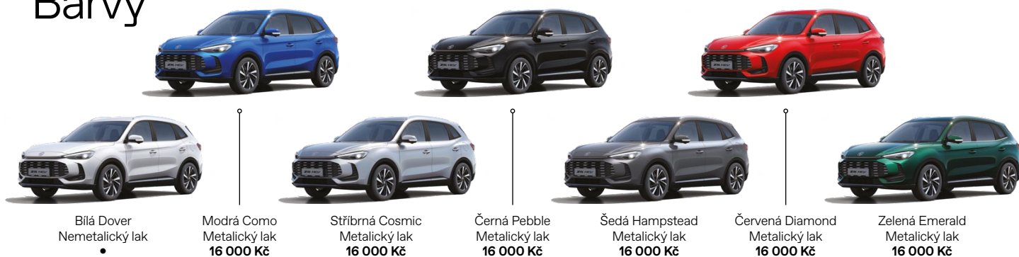
Bílá Dover Nemetalický lak