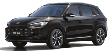
● ČERNÁ PEBBLE METALICKÝ LAK 16 500 Kč