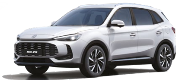
○ BÍLÁ DOVER ZÁKLADNÍ LAK