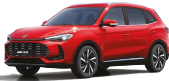
● ČERVENÁ DIAMOND METALICKÝ LAK 16 500 Kč