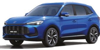
● MODRÁ COMO METALICKÝ LAK 16 500 Kč