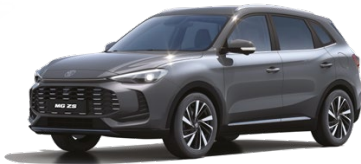
● ŠEDÁ HAMPSTEAD METALICKÝ LAK 16 500 Kč