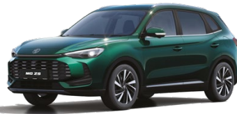
● ZELENÁ EMERALD METALICKÝ LAK 16 500 Kč