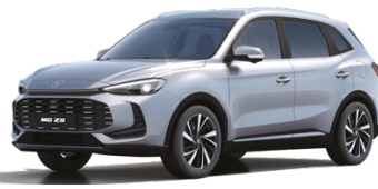
○ STŘÍBRNÁ COSMIC METALICKÝ LAK 16 500 Kč